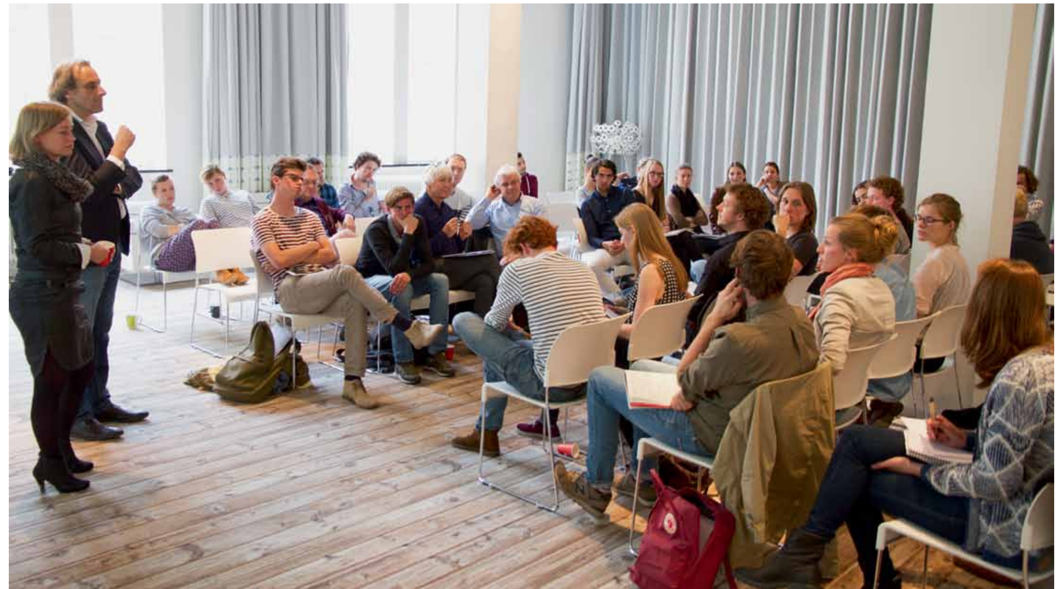
In het debat over DNA komen verschillende opvattingen over de rol van de architect aan de orde.